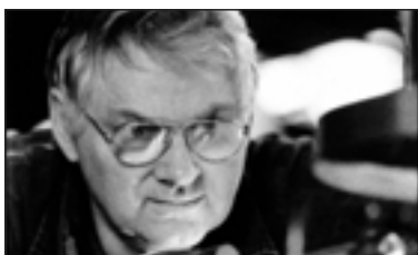
Сотрудники KSB – Мы приводим Ваш мир в движение

Амасан К – это надежный насос для сложных случаев. Чувствует себя как дома в средах, где другая гидравлика для трубных каналов давно сдалась.