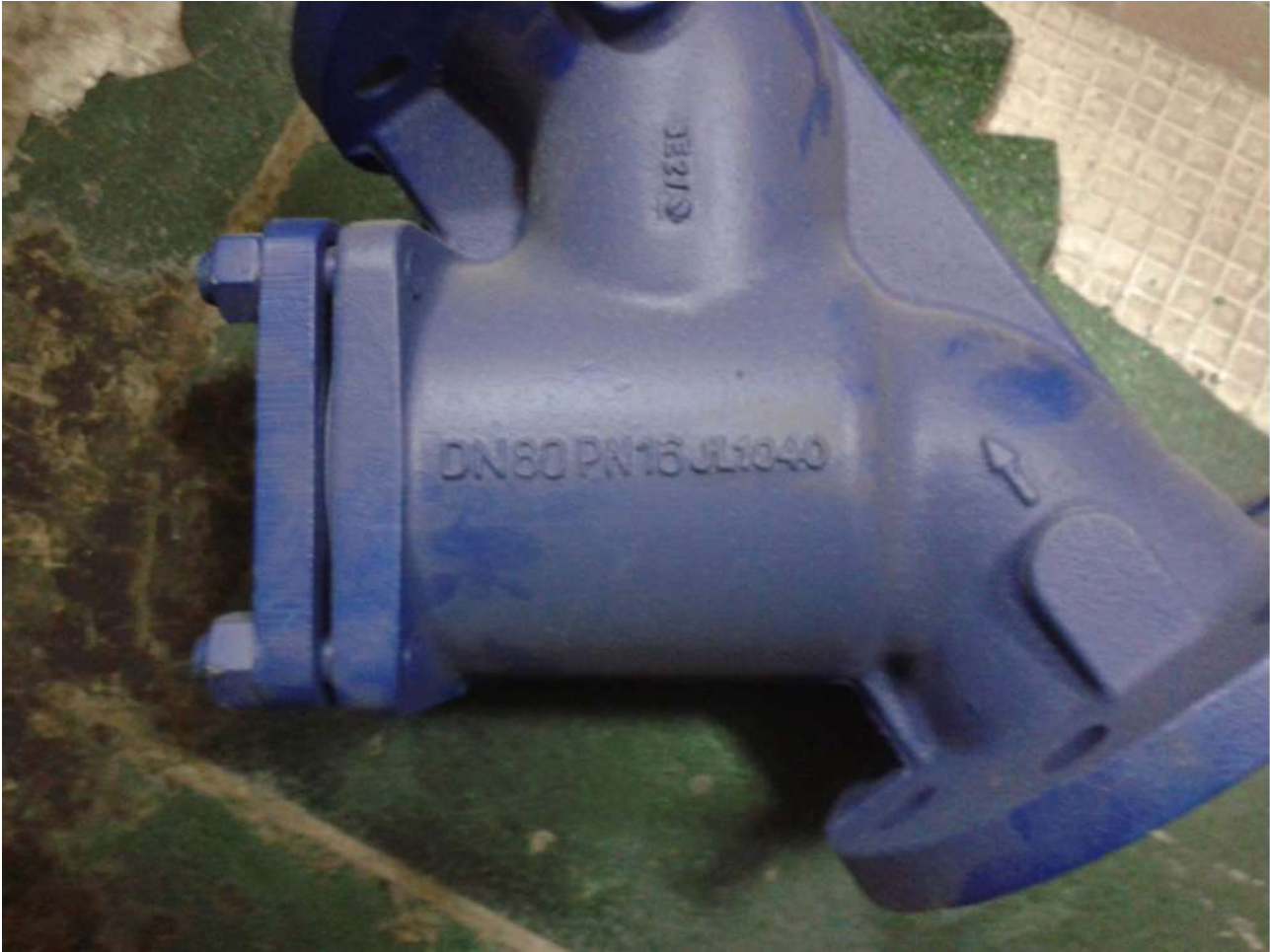
Фильтр BOA-S DN80 PN16