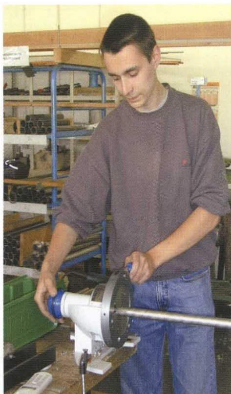
Применение на практике

Производитель оставляет за собой право вносить изменения в технические характеристики устройства, а также другие изменения. Действуют общие условия продажи.