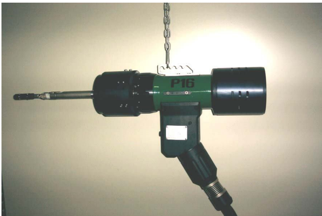
Удлиненная сварочная головка P16