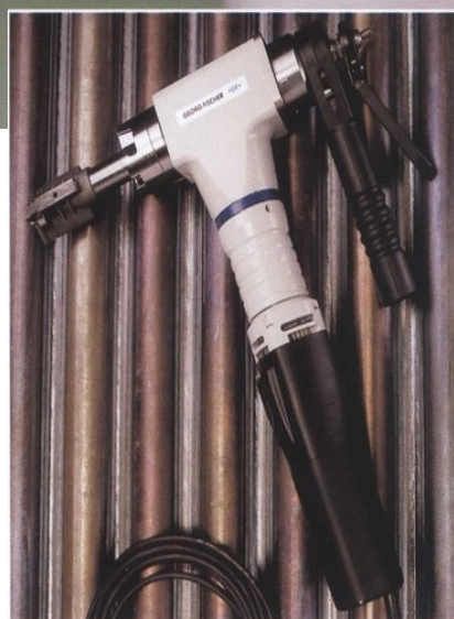
BRB с электрическим приводом

Идеальное оборудование для высокоточной обработки сварочных швов труб котлов с электрическим или пневматическим приводом.