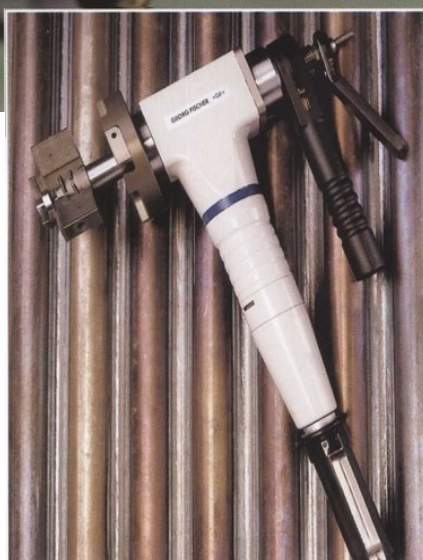
BRB с пневматическим приводом